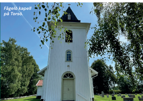
Fågelö kapell på Torsö.

Välkommen på "Sommarmusik i Fågelö kapell" kl. 19.00 fredagarna vecka 27-31.