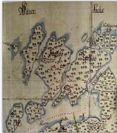
På kartan från 1655, fortfarande två öar, Fågelö och Torsö.

Torsö är Vänerns största ö, från början två öar, Torsö och Fågelö. Genom invallning av sjöbotten i sundet mellan